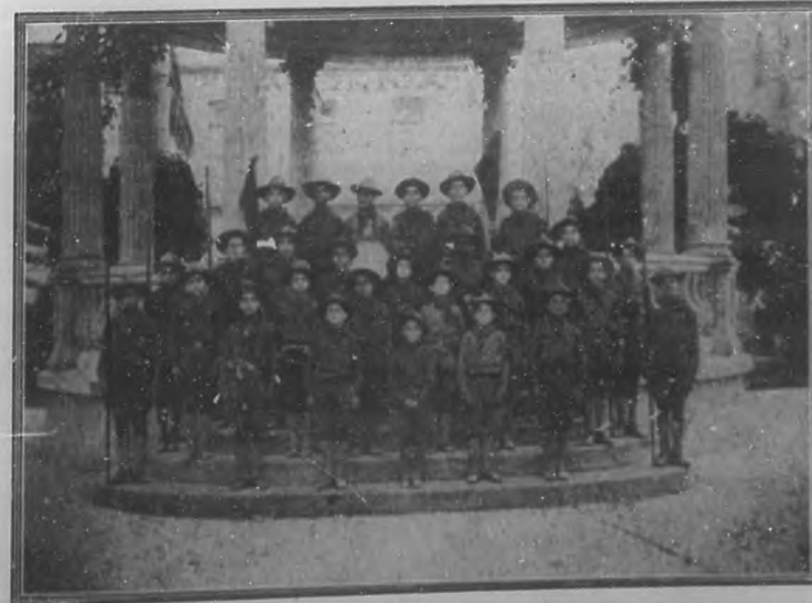
Interesante grupo formado por los simpáticos y esforzados exploradores guanajayenses, en el parque de la población.