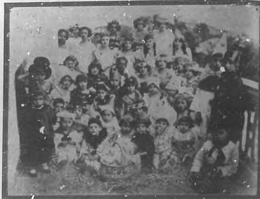
Un grupo de niños que asistieron al Baile Infantil celebrado en el Central "Tinguaro" recientemente.