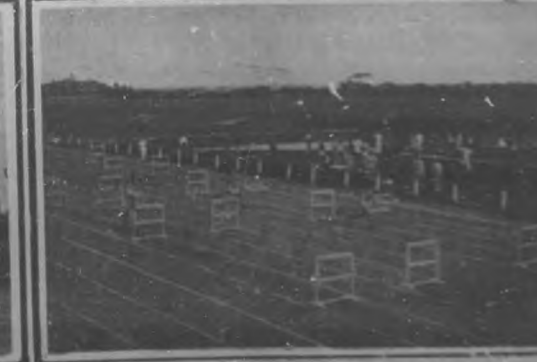
LAS COMPETENCIAS ATLETICAS NACIONALES.—A la izquierda: El vencedor en la carrera de 1,500 metros, llegando a la meta.—A la derecha: Un interesante aspecto de las carreras de obstáculos.