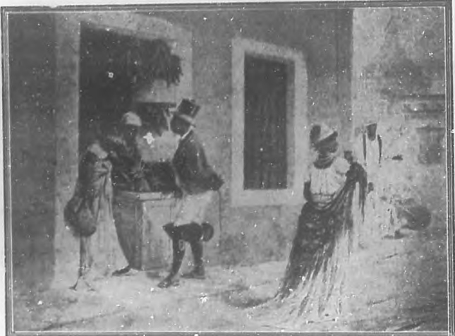
EL PUESTO DE FRUTAS Dibujo de Landaluce.

A todas éstas, Torcuato y María Justa habíanse despedido de ña Tula, (Pasa a la Pág. 24.)