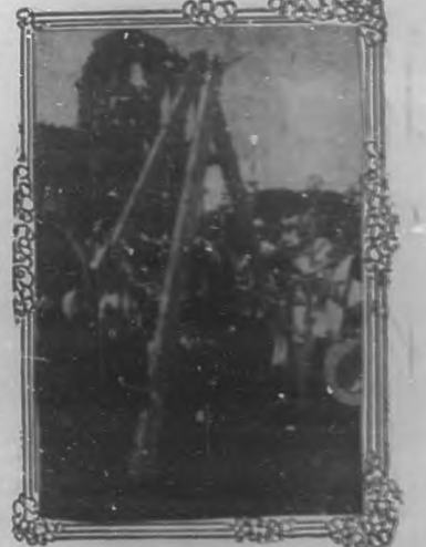
La fiesta de la Caridad en Pinar del Río. Acto de la bendición y colocación de la primera piedra de la Ermita de la Caridad del Cobre, por el señor Obispo.

También la propia casa nos ha enviado un ejemplar de "La Evasión", por Benito Lynch. Van en ese tomito unos trabajos admirables del argentino Benito Lynch, escritor cuya sinceridad nos traspaasa íntegra la emoción que recibe de las cosas. La Evasión es una novela argentina presentada en un raro estilo de sencillez que realiza el mérito de la verdad reflejada a través de sus páginas.