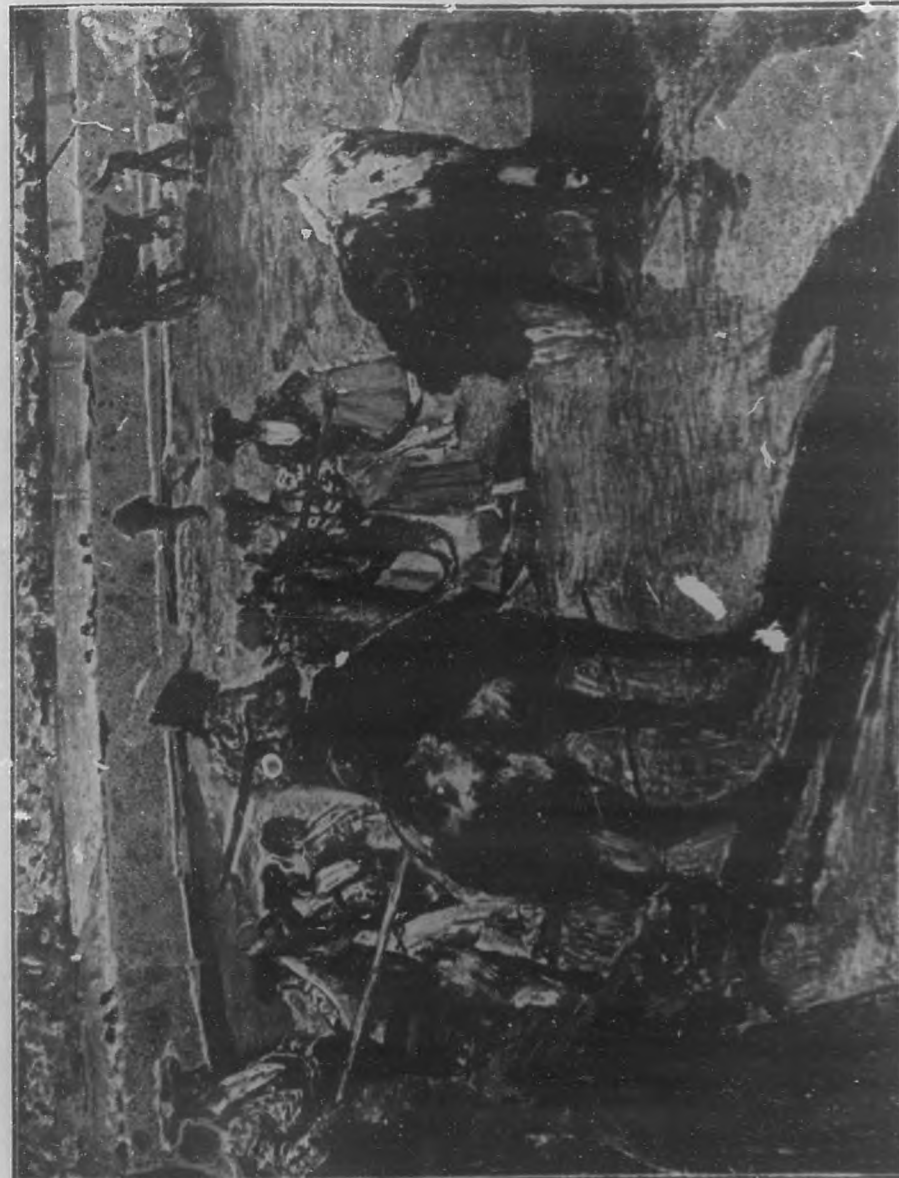
EL PICADOR Cuadro de A. Lumois